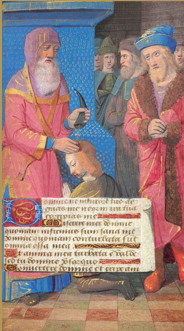
Kniha hodiniek, Francúzsko. Žalm 6, 15. storočie.